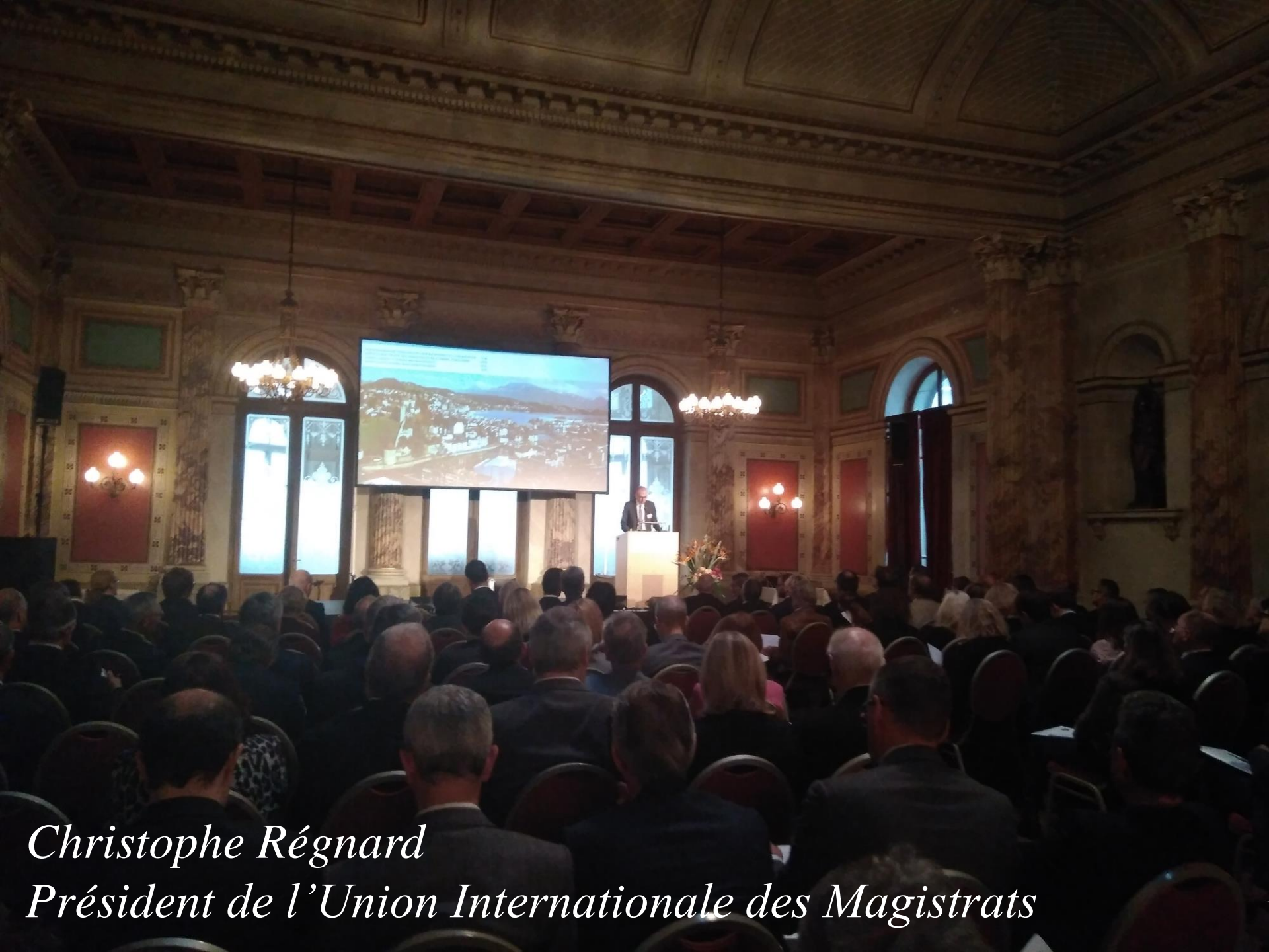
Christophe Régnard Président de l'Union Internationale des Magistrats