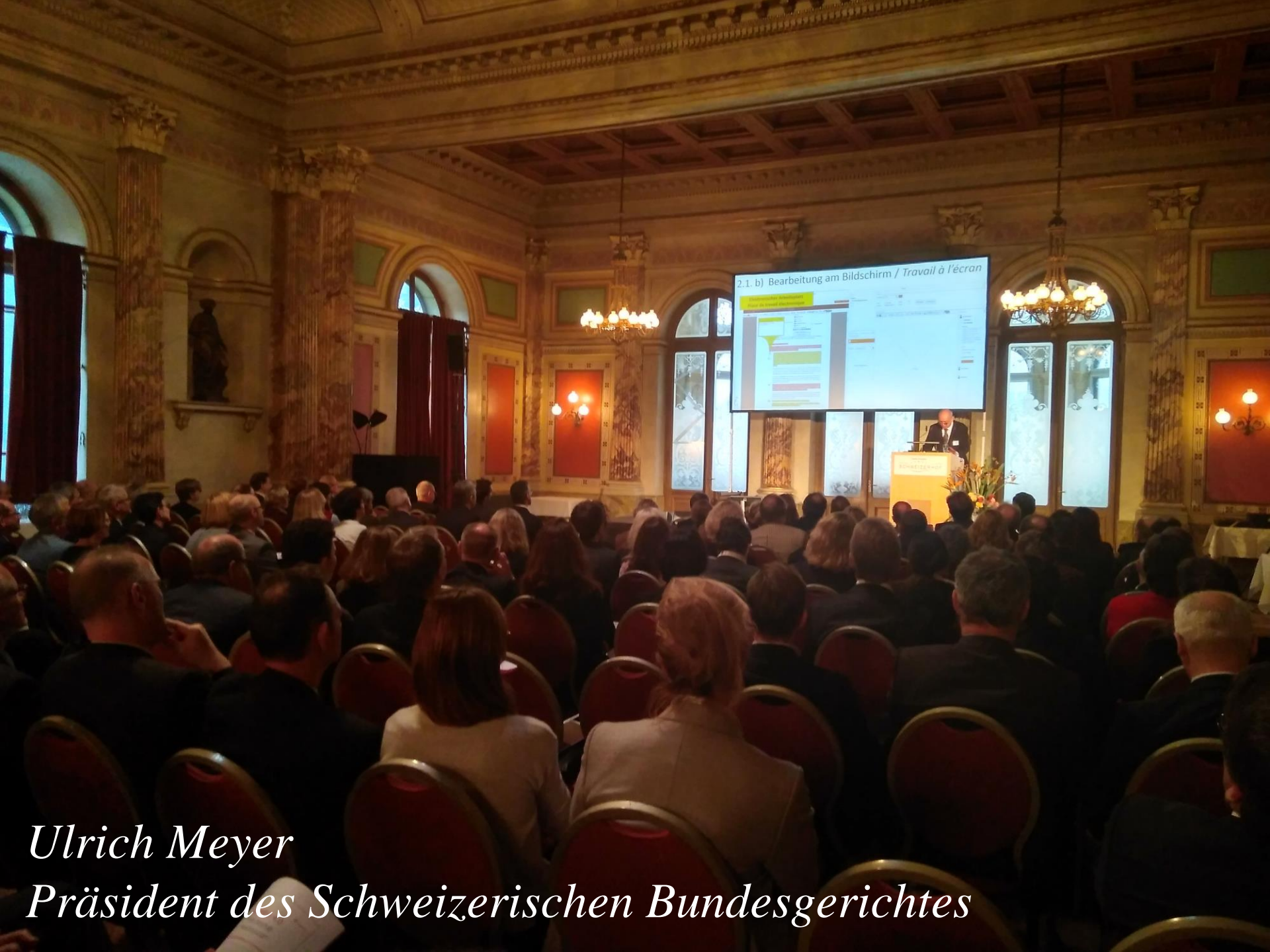
Ulrich Meyer Präsident des Schweizerischen Bundesgerichtes